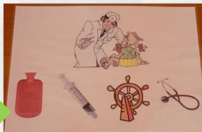
Дидактическая игра «Что делает?»