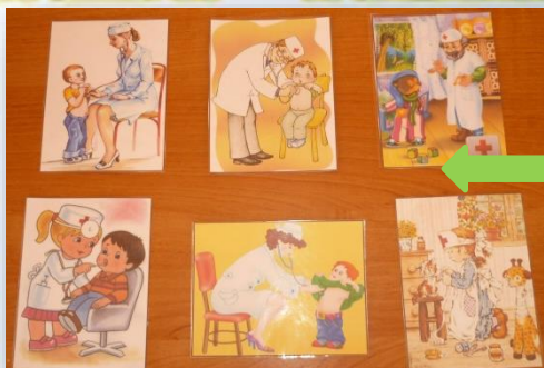
Дидактическая игра «Расскажи о том, что видишь»