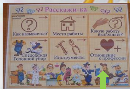
Мнемотаблица «Расскажи-ка о профессии...»