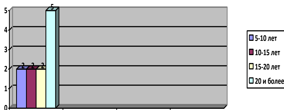
Рисунок 2. Распределение педагогического персонала по уровню образования